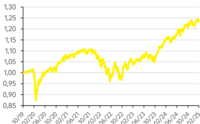
Vývoj hodnoty fondu Strategy 30